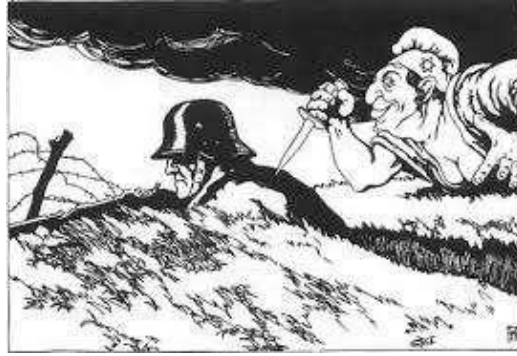
Representació en imatge de la teoria “la punyalada per l’esquena”

Un altre de les coses que van utilitzar van ser les teories racials abans anomenades per justificar anar en contra dels jueus. Ells afirmaven que la raça ària alemanya està entre els pobles superiors i defensaven que s’havia d’expandir i purificar, prohibint la barreja racial, mentre els jueus eren inferiors igual que els pobles eslaus.