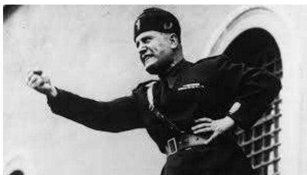
Mussolini fent un discurs