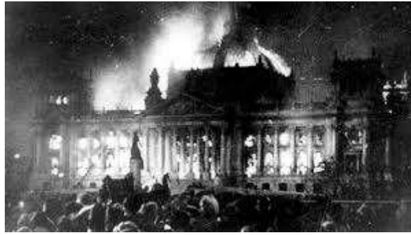
Incendi del Reichstag