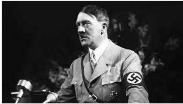
Hitler donant un discurs als seus seguidors

“Compatriotas alemanes... el 30 de enero se formó un nuevo gobierno nacional. Yo, y conmigo el movimiento nacionalsocialista, nos hemos incorporado a él. Siento que el objetivo por el que tanto he luchado en los años pasados, ha sido alcanzado”, Hitler, primer discurs com a canceller. (30 De Enero De 1933: Ascenso De Hitler Al Poder, n.d.)