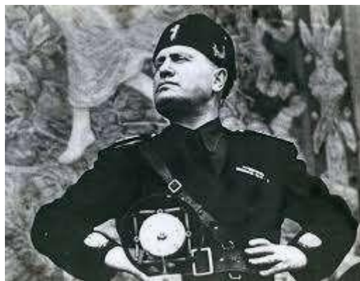
Mussolini, líder del feixisme

El feixisme va començar el 1919 amb la fundació del Fasci Italiani di Combattimento per part de Mussolini, un grup paramilitar ultranacionalista que es van erigir en els defensors de les reivindicacions nacionalistes dins d'un programa nacionalitzador.