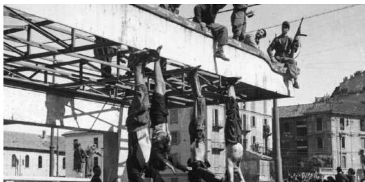
Cos de Mussolini penjat

Al final amb la guerra devastant el país, el rei Víctor Manuel III va aconseguir el 25 de juliol de 1943 amb l’ajuda dels aliats més propers apartar-lo del poder i ficar-lo a la presó. Tot i això, Mussolini va aconseguir fugir i va dirigir la República de Saló, un país titella de Hitler al nord i centre d’Alemanya, però el 27 d’abril de 1945 quan es veia venir que els aliats anaven a guanyar la guerra, Mussolini va intentar fugir sense èxit, ja que el van detenir uns partisans, i el 28 d’abril de 1945 el van disparar i assassinar. El seu cos va acabar penjat en una plaça pública de Milà on la gent va anar allà per profanar-lo després de tot el que havia provocat.