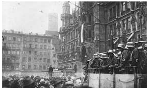
Putsch de Múnich Font:

Aquest intent va fracassar i Hitler va ser empresonat un any; tot i això, no va renunciar a les ambicions de poder i a la presó va escriure el Mein Kampf (1925), un llibre en el qual va escriure els principis bàsics del nazisme.