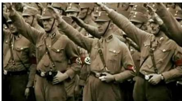
SA fent la salutació nazi Font:

El nazisme va començar el 1919 a Munich amb la creació del Partit Obrer Alemany, un dels més nombrosos partits nacionalistes amb idees antiliberals i racistes, però pròpiament la història del nacionalsocialisme comença amb l'ingrés de Hitler. El 1920 es va elaborar un programa de 25 punts i es canvia el nom al Partit Nacionalsocialista Alemany i es crea les SA, el grup paramilitar nazi. Hitler, elegit en 1921 com a líder, va fer que el partit nazi gires entorn d'ell.