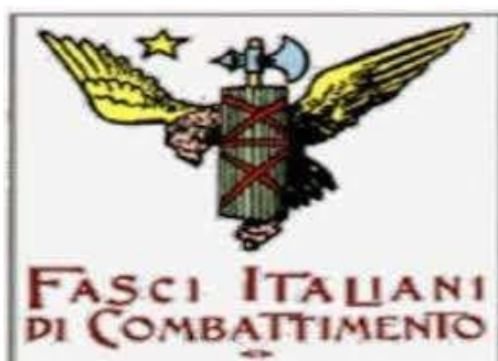
Símbol Fasci Italiani di Combattimento Font:

Es considera l'inici del feixisme la creació dels Fasci Italiani di Combattimento a Milà el 23 de març de 1919. Aquest va ser un grup paramilitar ultranacionalista amb programa socialitzador conformat per persones heterogènies (des d'anarquistes fins a nacionalistes d'extrema dreta) que actuava contra la gent que anava en contra del seu pensament, per això una de les primeres accions violentes, executat pels esquadrines, va ser destruir el 1919 la seu del diari socialista Avanti . (Fernández Ros et al., 2022, p.236-237)