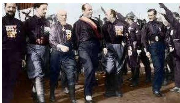
La marxa de Roma

El 27 d'octubre es va començar a prendre ajuntaments a ciutats com Florència i Pisa i aquella nit diverses columnes de camises negres van anar camí Roma semblant el caos per les ciutats que passaven i prenent edificis tot i no ser més de 300.000 homes (ara bé, Mussolini no els va acompanyar sinó que ho va veure tot des de Milà).